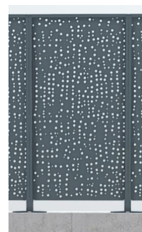
Vue arrière de la clôture