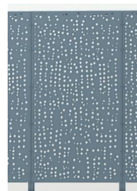
Vue de face de la clôture

La mise en plan du kit modulaire CLOTYRA permet de fabriquer une clôture sur mesure pour tout type de terrain avec des platines ajustables aux besoins du chantier.