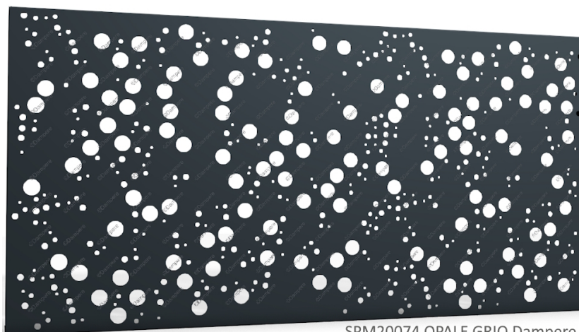
SPM20074 OPALE GRIO Dampere

Pour un rapport portée/prix optimisé, nous vous conseillons la tôle OPALE GRIO en Acier Galva épaisseur 1.5 mm